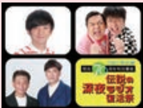
伝説の深夜ラジオ復活祭

また、新規リスナーの開拓を目指し、10月から、CBCラジオの次世代を担う若手パーソナリティを起用した『ゆるゆる』（火～木曜 19:00～21:00放送）と『ツレゆる』（火～木曜 21:00～21:30放送）を編成し、この地方の夜を盛り上げていきます。