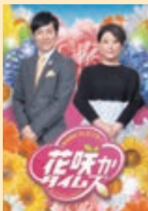
なるほどプレゼンター! 花咲かタイムズ

4月にリニューアルした報道情報番組『チャント!』(月～金曜 15:49～19:00放送)は、子育て世代の女性キャスターを起用し、“より生活者目線でわかりやすく”にこだわった制作を続けており、これまでより幅広い視聴者層を獲得しています。