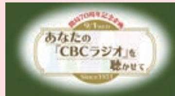
あなたの「CBCラジオ」を聴かせて